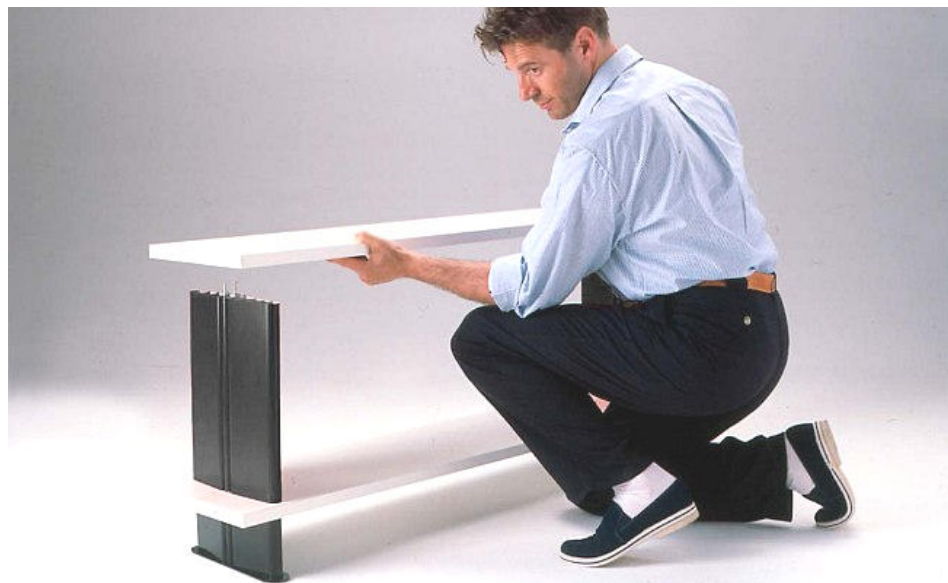
03 Appoggiare il ripiano, ed inserire il tiranti nei fori del 2° ripiano Place the shelf, and insert the bolts into the holes of the 2nd shelf