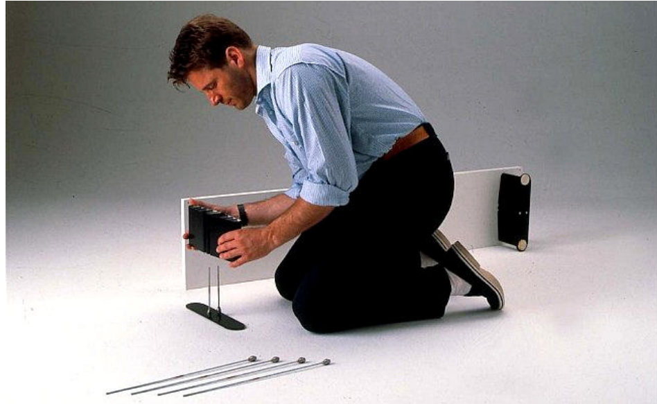
01 Inserire piedi nel 1° ripiano - Enter foot in the 1st shelf