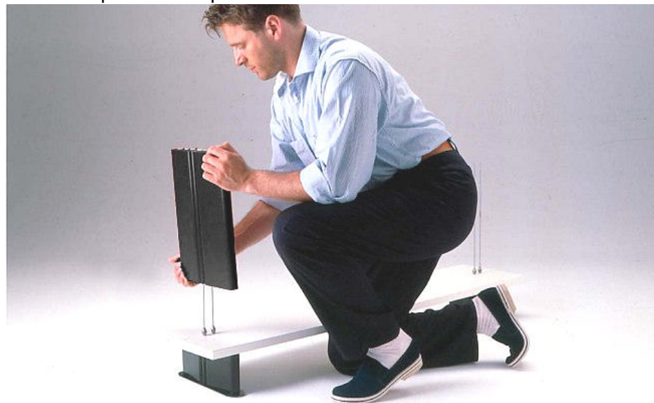
02 Avvitare i tiranti ed inserire il fianco - Screw the tie rods and insert the side